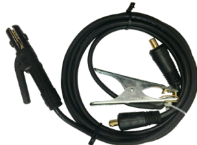
Welding cables 200A Jeu de câbles 200A