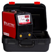
Inverter suitcase 42X34X25 Valise pour Inverter 42X34X25