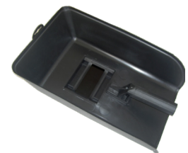
Hand welding mask MM1010 Masque à main MM1010